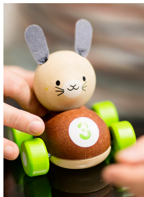
Kiddex Oy maahantuo laadukkaita ja vastuullisesti tuotettuja lastentarvikkeita.

– Jokainen työntekijä meillä tuntee Kiddexin vision ja mission. Henkilökuntaa on alettu myös palkita niin, että jokaisesta työntekijästä tulee ajan myötä osakas. ■